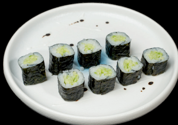
76. Pepino 4u Cogombre/Cucumber