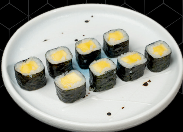
75. Mango 4u Mànec / Mango